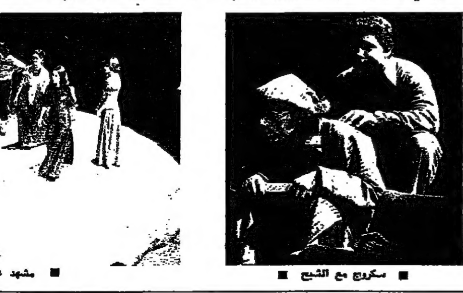
سكروج مع الشبح